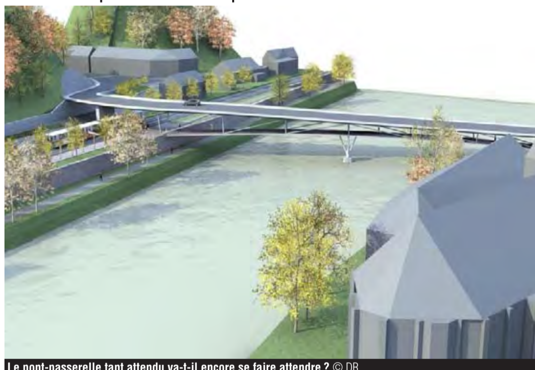
Le pont-passerelle tant attendu va-t-il encore se faire attendre?

Beaucoup attendent donc avec impatience la liste des projets retenus que le ministre Bellot devrait bientôt transmettre aux Régions. En espérant que le pont-passerelle y figurera bien et n'aura pas été victime des contraintes budgétaires. GEOFFREY WOLFF